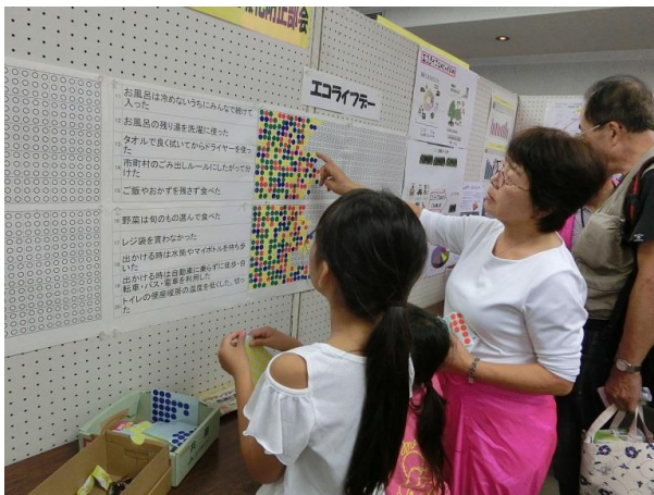
エコライフデー 親子で参加が多かった