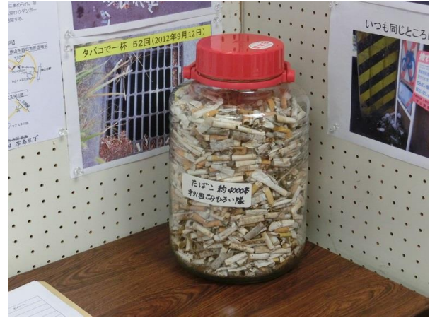
4000本のタバコにびっくり