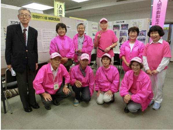
地球温暖化防止部会のメンバー