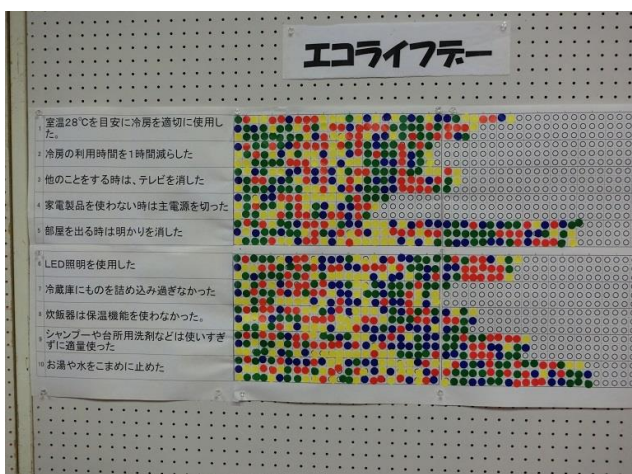
エコライフデー 約150名が参加