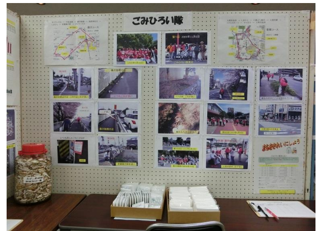
ごみひろい隊の紹介