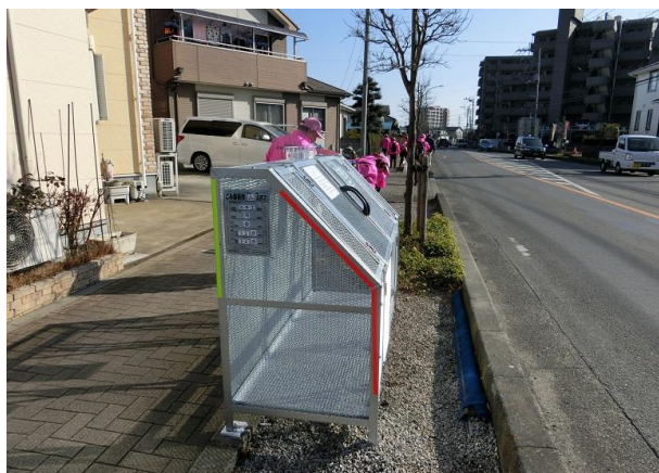
新しいゴミ箱が新設