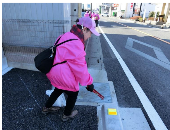
でもほんの数メートルで終わり