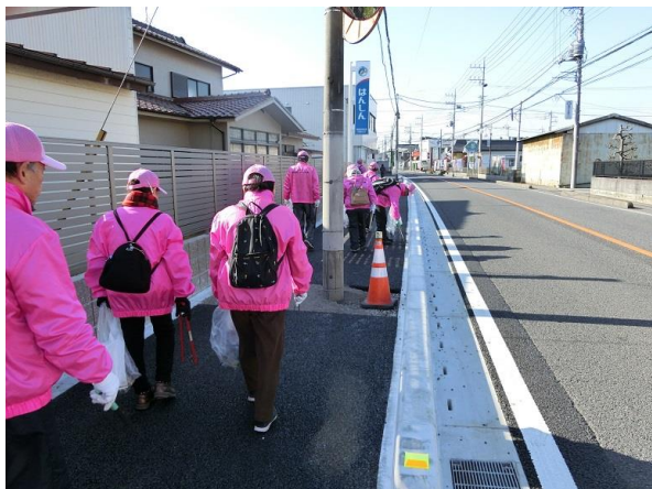
歩道が新設、危険度は下がった