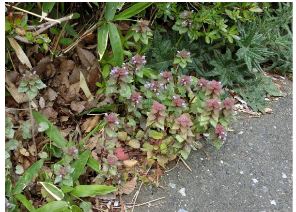
ヒメオドリコソウ