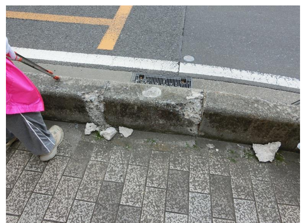
激しく車がぶつかった縁石