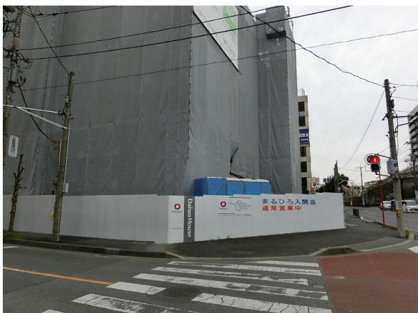
豊岡整形外科建築中