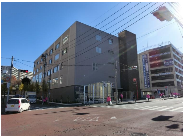
移転した豊岡整形外科病院