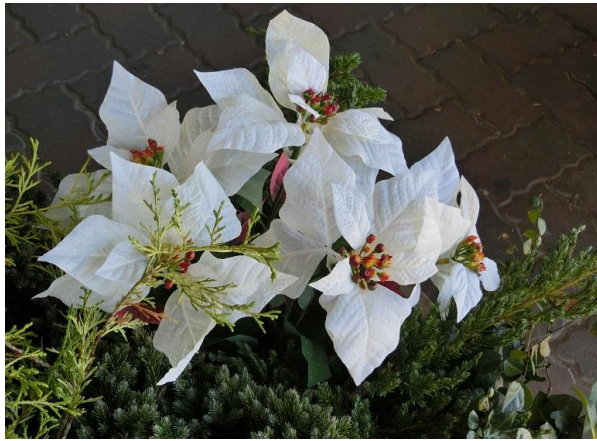
白色のポインセチア