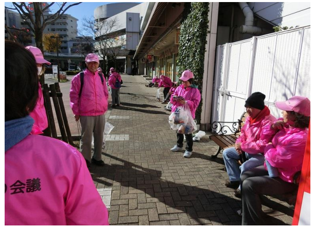
休憩タイム 話が弾む