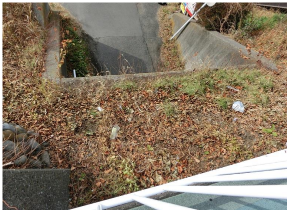
手の届かない場所にゴミが